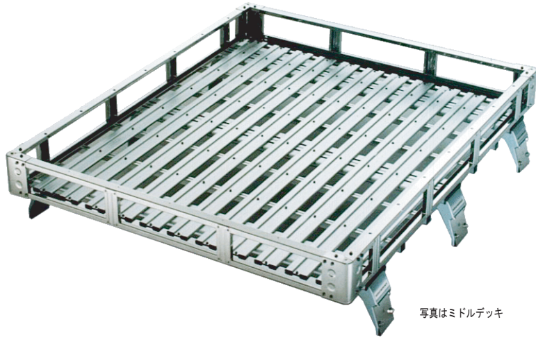
写真はミドルデッキ